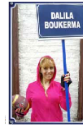
Hommes et les femmes leur nouveau cheval de bataille.

Les sujets sont graves (l'exclusion, l'homophobie latente...) mais le ton souvent burlesque. Plus engagés que jamais, ces Nordistes ont fait de la lutte contre l'inégalité entre les